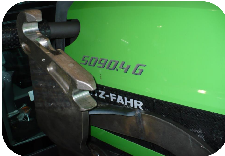
Deutz Fahr 5090.4 G